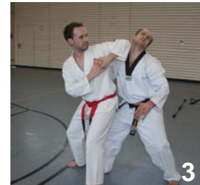
Gegenwehr mit Technikeinsatz